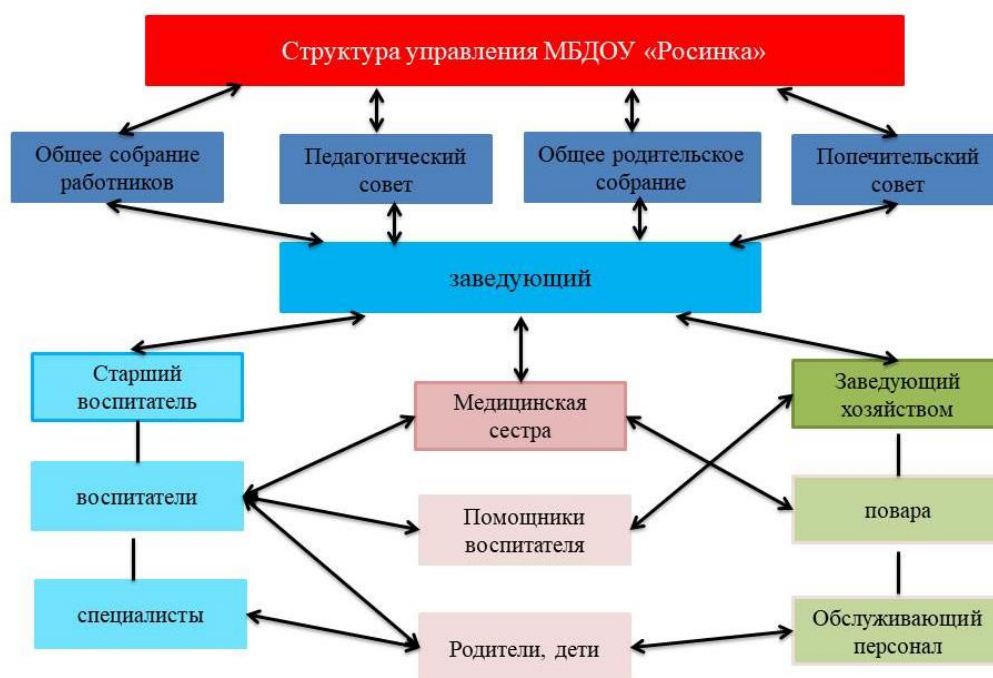
Органы управления, действующие в МБДОУ «Росинка»

Управление МБДОУ «Росинка» осуществляется в соответствии с действующим законодательством и Уставом, на принципах единоначалия и коллегиальности. Коллегиальными органами управления являются: педагогический совет, общее собрание работников, попечительский совет, Общее родительское собрание родителей (законных представителей) воспитанников. Единоличным исполнительным органом является руководитель - заведующий.